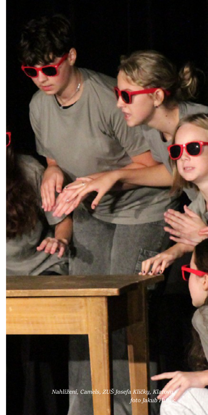
Nahlížení, Camels, ZUŠ Josefa Kličky, Klatovy

The portal with a specialized map with professional content in the film and audio-visual education is the output of research by NIPOS and the Association for Film and Audio-visual Education. The map represents a summary of current and verified information in the form of a database and interactive map. It is updated continuously.