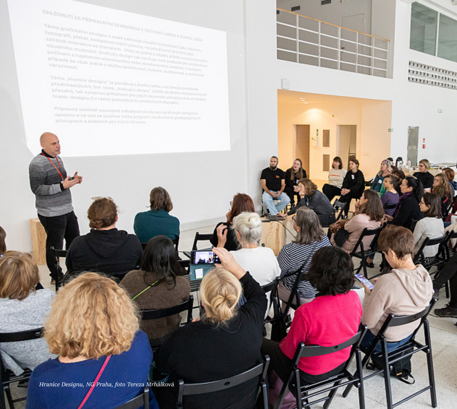
Hranice Designu, NG Praha