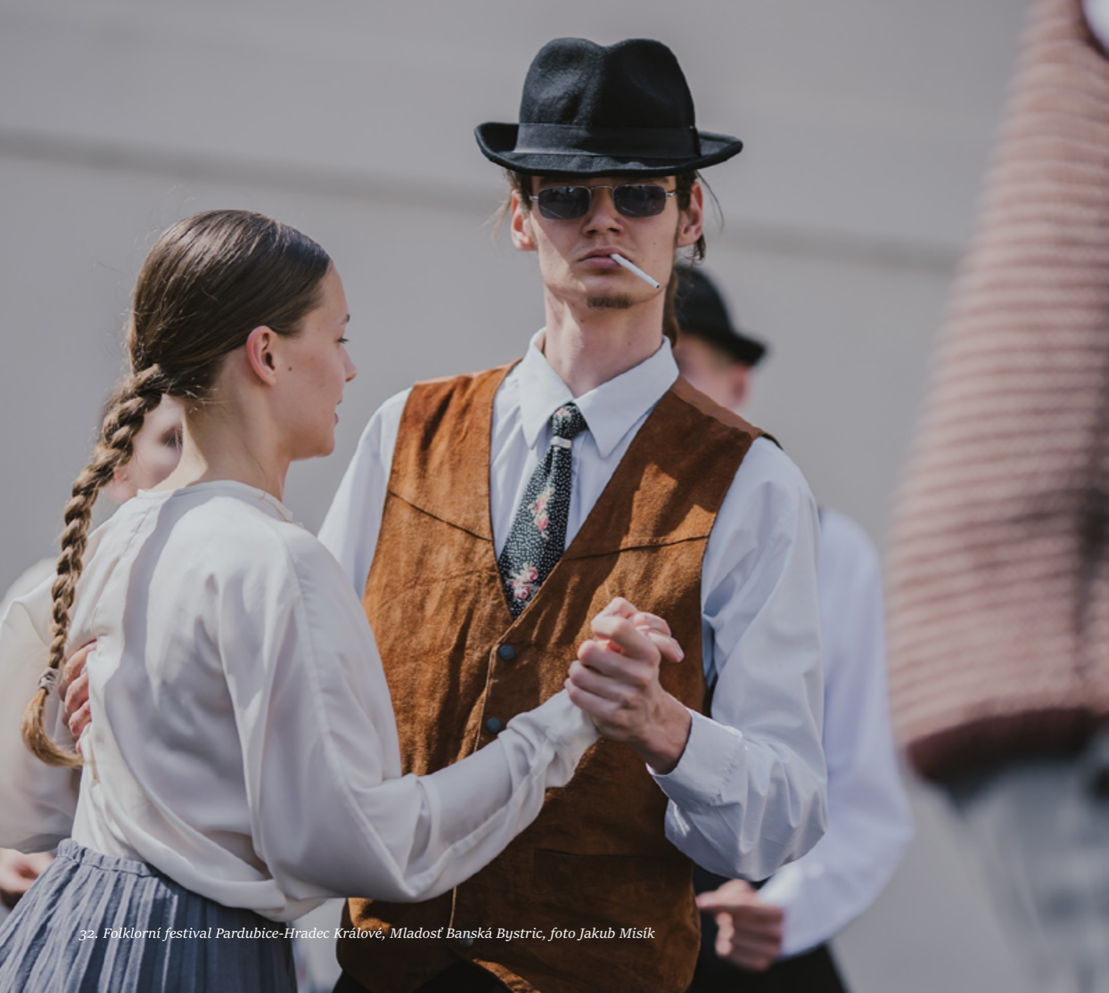
32. Folklorní festival Pardubice-Hradec Králové, Mladost Banská Bystric