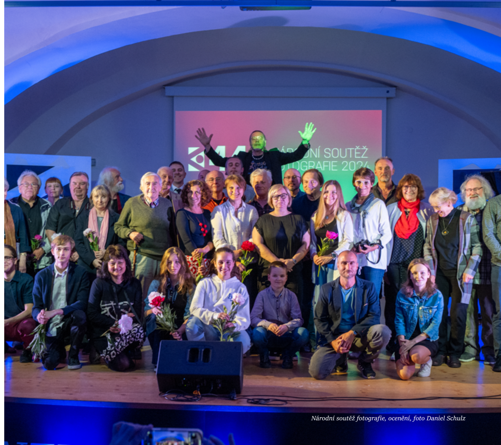
Národní soutěž fotografie, ocenění