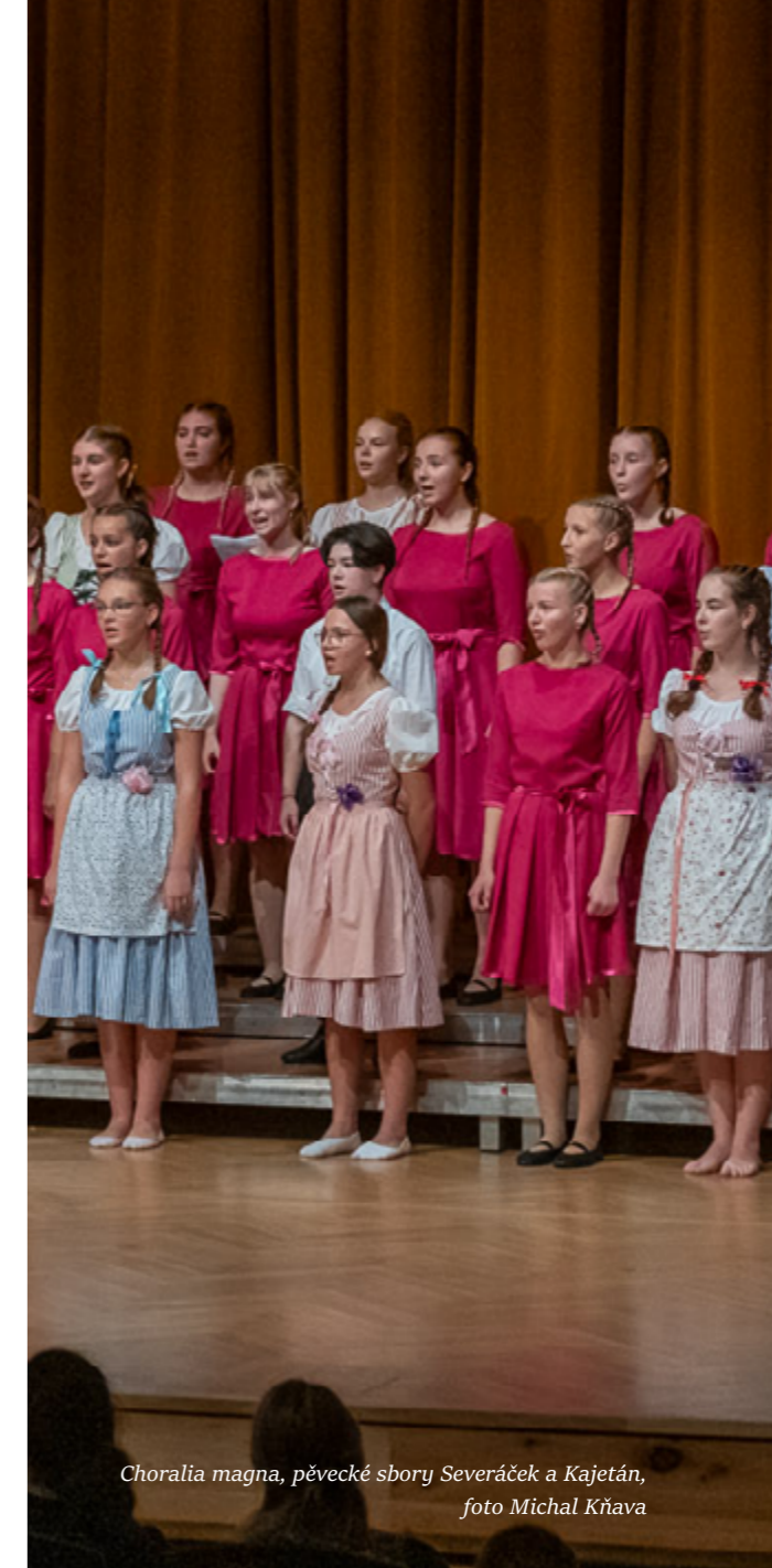
Choralia magna, pěvecké sbory Severáček a Kajetán

Na semináři se účastníci ve specializovaných ateliérech věnovali metodice nácviku, dirigování a také samotnému zpívání sborových skladeb různých úrovní pokročilosti podle svých dosavadních zkušeností a schopností, vše pod vedením profesionálních lektorů. Slavnostním vyvrcholením byl závěrečný koncert, na němž vystoupilo přes 80 účastníků a víc než 20 sbormistrů. Zazněly skladby jubilujících autorů i současných skladatelů (Antonín Tučapský, Miroslav Raichl, Zdeněk Lukáš atd.).