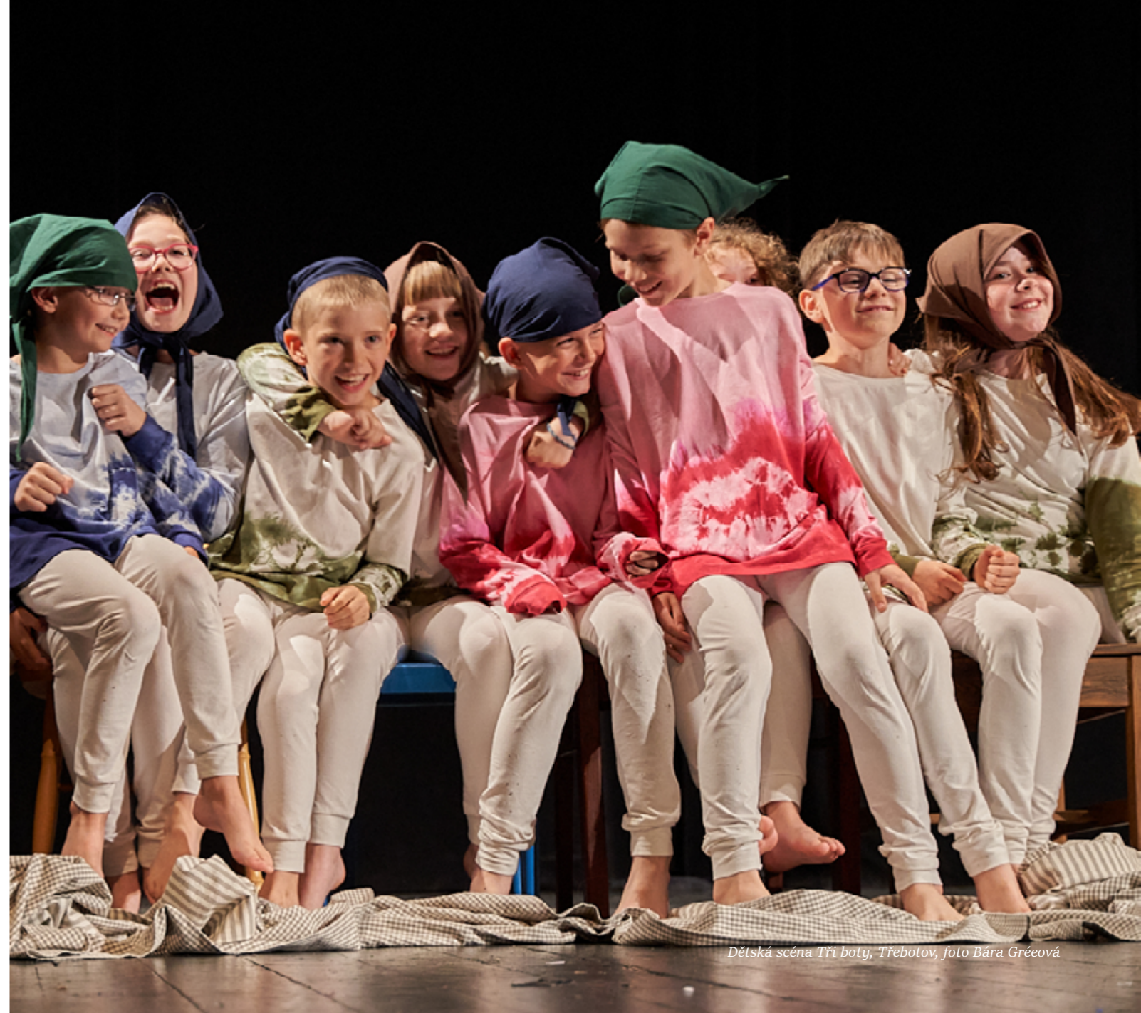
Dětská scéna Tři boty, Třebotov, foto Bára Gréevá

Tento výzkum je realizován na základě institucionální podpory dlouhodobého koncepčního rozvoje výzkumné organizace poskytované Ministerstvem kultury (IP DKRVO).