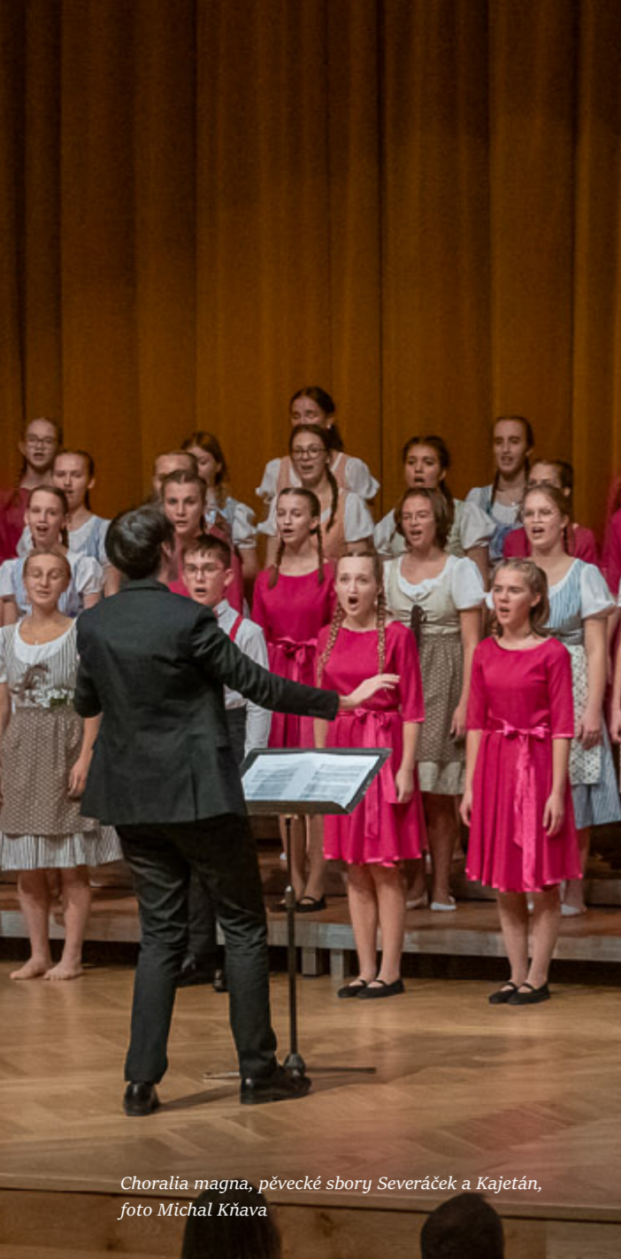
Choralia magna, pěvecké sbory Severáček a Kajetán