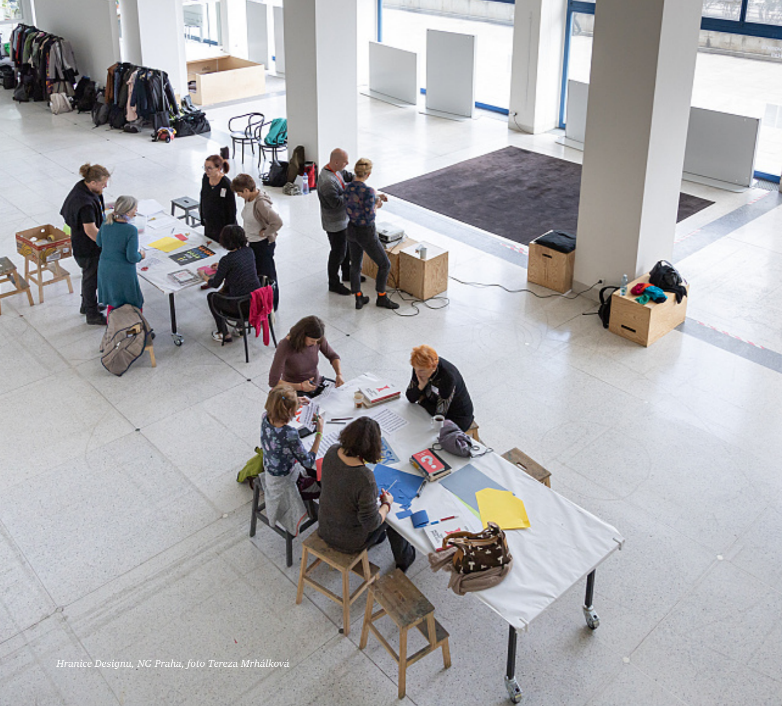
Hranice Designu, NG Praha