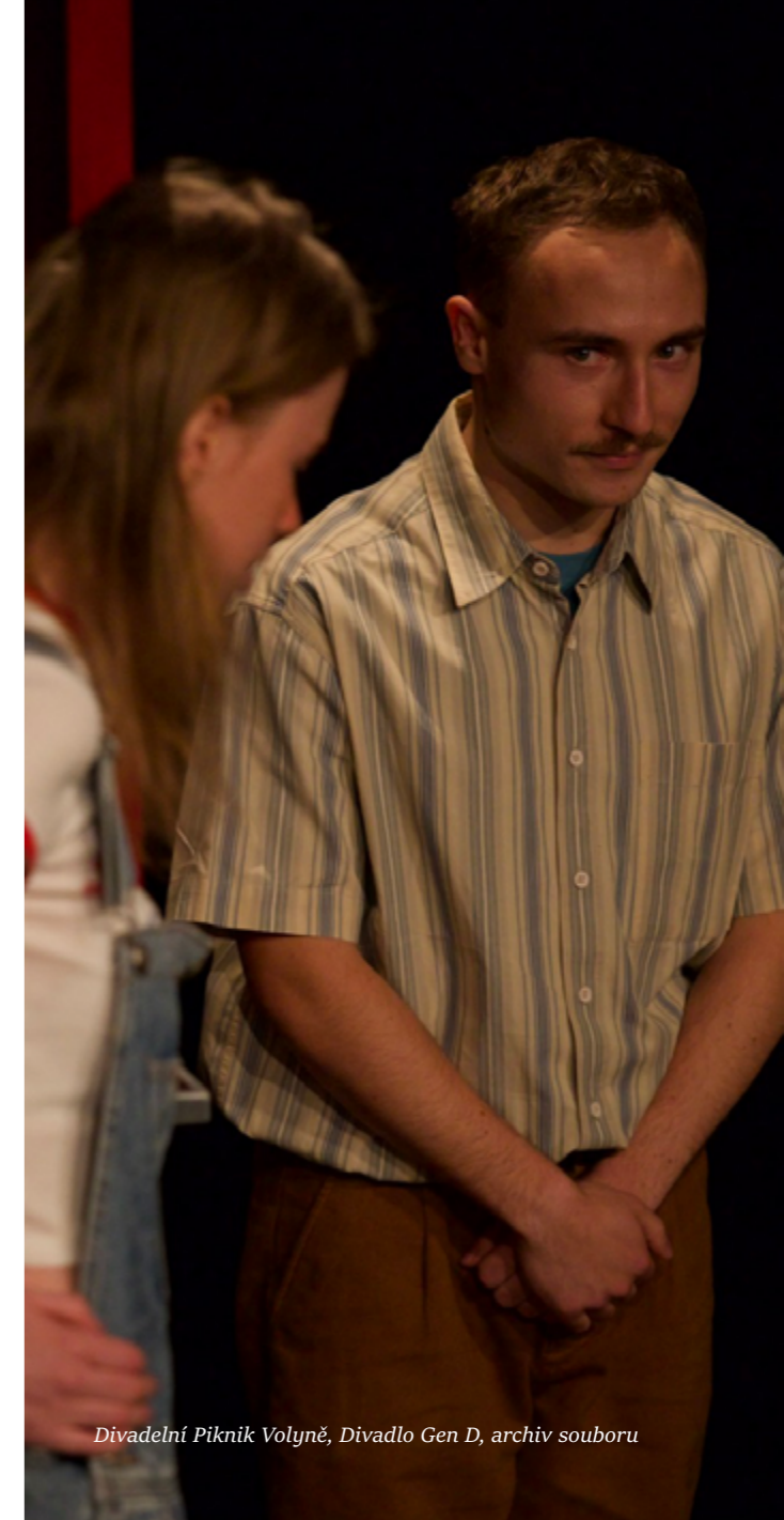
Divadelní Piknik Volyně, Divadlo Gen D

Do oblasti zahraničních kontaktů NIPOS patří i cesty pracovníků NIPOS sloužící k doplnění jejich odbornosti či lektorská účast na zahraničních akcích. Těchto cest se však uskutečnilo minimálně.