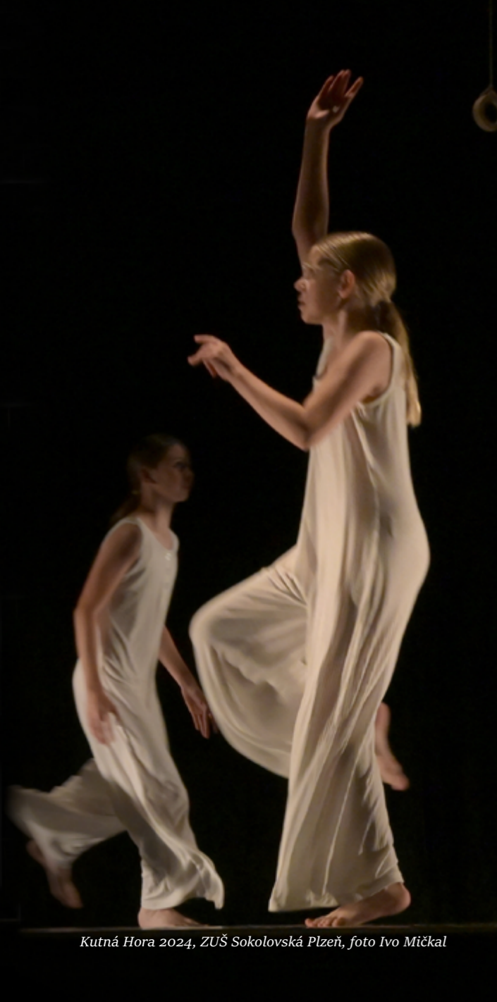
Kutná Hora 2024, ZUŠ Sokolovská Plzeň, foto Ivo Mičkal

a ze Slovenska Štefan Sedlický, která sbory ohodnotila zlatým, stříbrným a bronzovým pásmem a poskytla jim zpětnou vazbu na rozborovém semináři. V sobotu večer se konal závěrečný koncert, kde zazpívalo postupně všech 12 soutěžících sborů (každý s jednou, porotou vybranou skladbou). V průběhu tohoto koncertu byly vyhlášeny výsledky soutěže. V neděli dopoledne se v atriu ZUŠ Liberec uskutečnilo společné zpívání všech zúčastněných sborů. Všechna páteční a sobotní vystoupení přehlídky proběhla v Aule Technické univerzity Liberec. V rámci Porta musicae se výjimečně nekonal seminář Klubu sbormistrů. Úroveň sborů účastnících se přehlídky byla obstojná, škála sborových výkonů však byla širší, než je běžně obvyklé, vystoupily zde i méně zkušené sbory, porota udělila tři bronzová pásma.