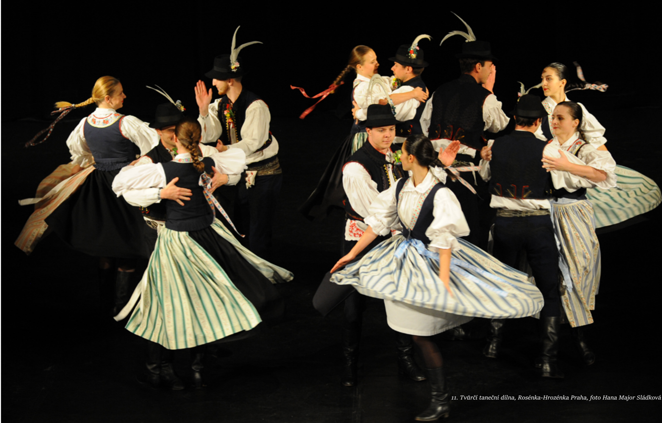
11. Tvůrčí taneční dílna, Rosénka-Hrozénka Praha

Každoroční účast na knižním veletrhu Svět knihy, který se tentokrát konal od 23. do 26. května 2024, byla opět podpořena novou grafickou podobou stánku a propagačními materiály, které vystihovaly všechny aktivity NIPOS. Knihovna zastřešovala celopodnikovou přípravu a realizaci akce, přičemž tržby z prodeje publikací se téměř zdvojnásobily oproti roku 2023.