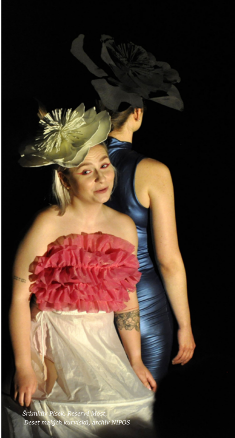
Šrámkův Písek, Reservé Most, Deset malých kurvíšek, archiv NIPOS