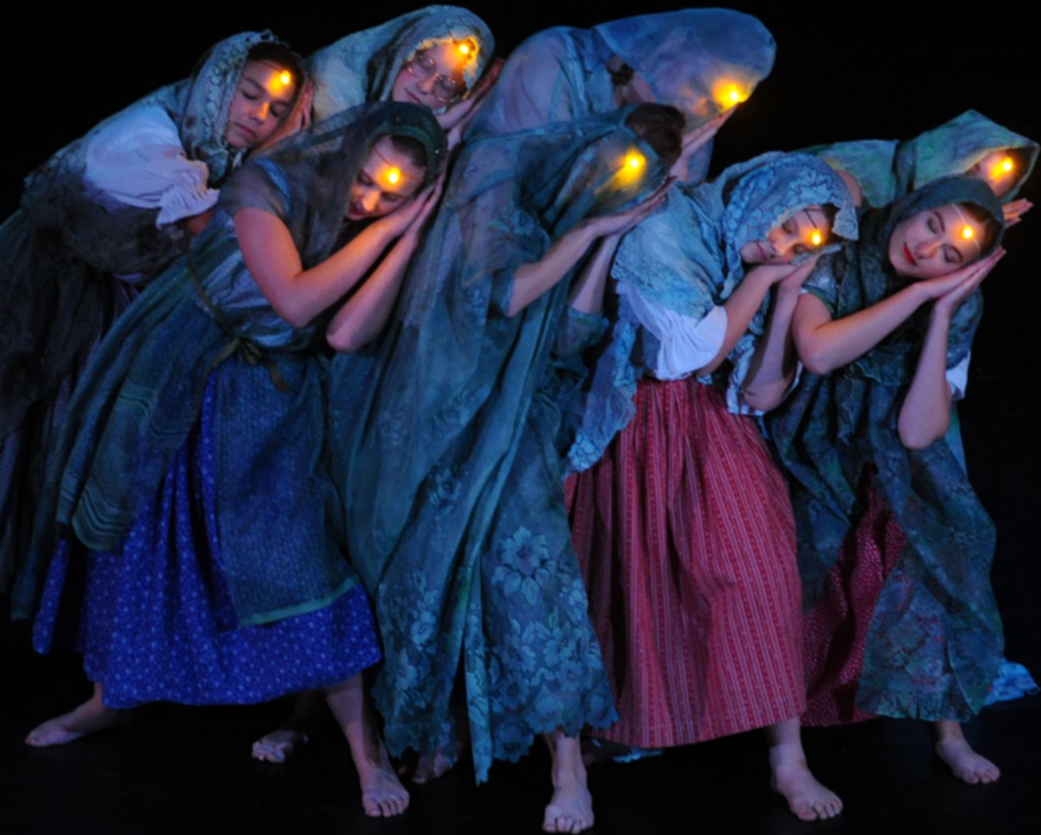
11. Tvůrčí taneční dílna, Šáteček Nymburk