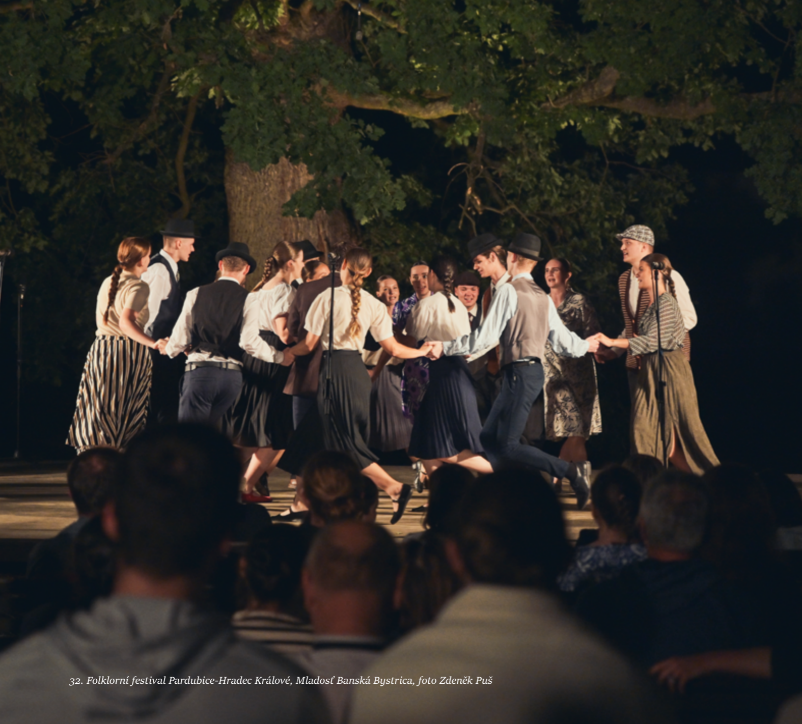
32. Folklorní festival Pardubice-Hradec Králové, Mladost Banská Bystrica