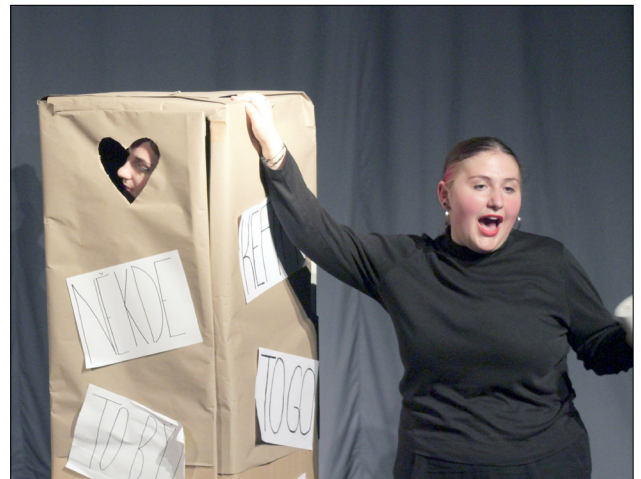
Slovomrak aneb divácký dojem z představení jedním slovem

smysl aktuální nedokument apelfraškamapa Babovřesky dvojpředstvení temporytmus netradiční problém