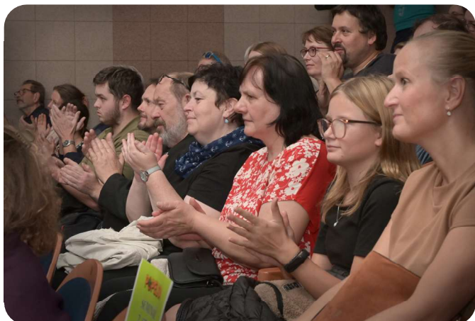
Diváci POPELKA 2023