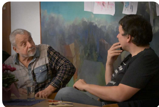
Rozborový seminář PRINCOVÉ JSOU NA DRAKA