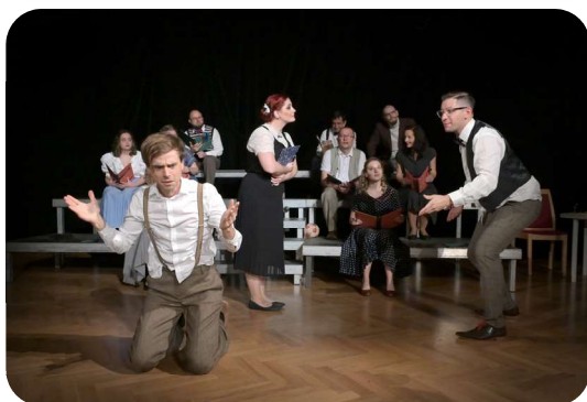
ŠKOLA ZÁKLAD ŽIVOTA