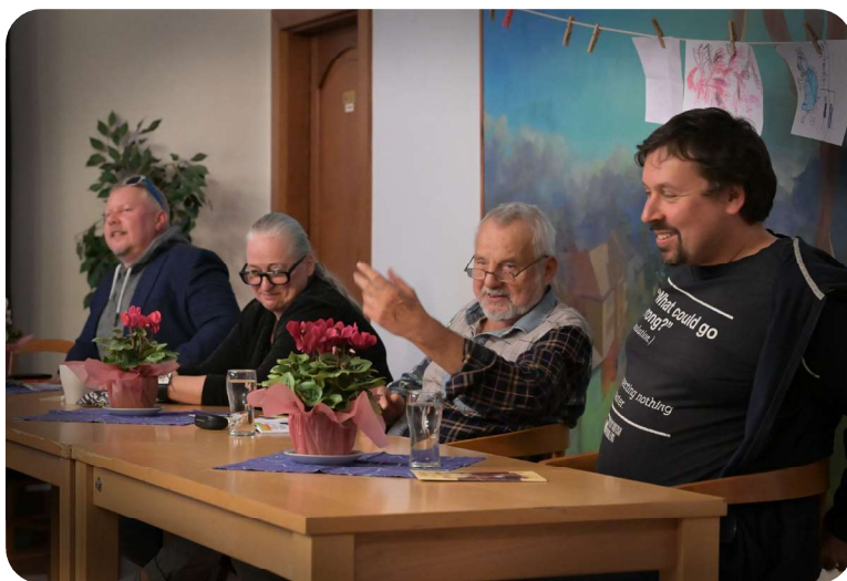
Rozborový seminář PRINCOVÉ JSOU NA DRAKA