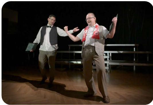
ŠKOLA ZÁKLAD ŽIVOTA