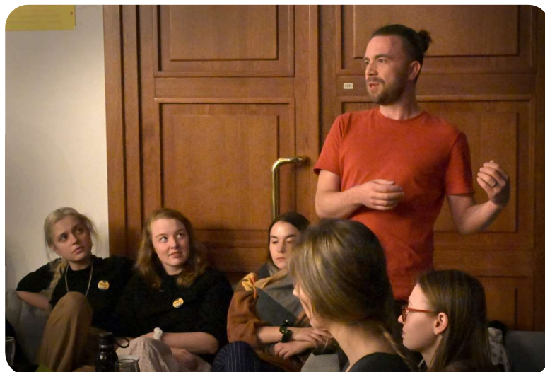
Rozborový seminář LABYRINT SVĚTA A RÁJ SRDCE

15.30, foyer Slavnostní zakončení Popelky Rakovník 2023, vyhlášení výsledků a předání ocenění