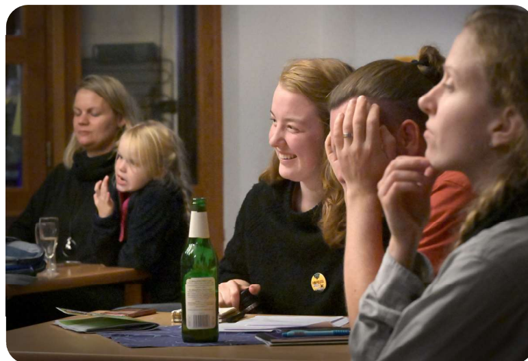
Rozborový seminář ZADLUŽENÁ PRINCEZNA