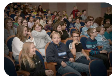
Diváci Popelka 2023