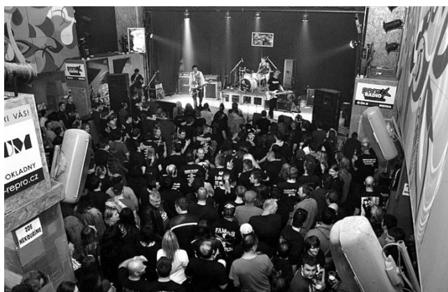
Divadlo Pod čarou

Šrámkovo divadlo je rovněž velkolepý, typicky městský podnik s vnější podobou z roku 1937 a poslední modernizací provedenou v roce 2010.