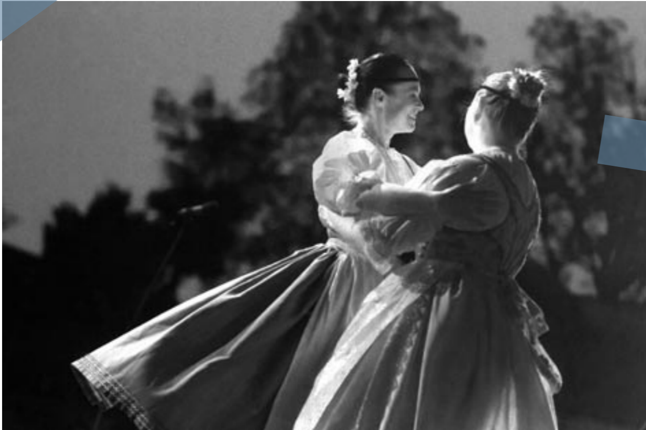
Archiv festivalu — FF Pardubice HK