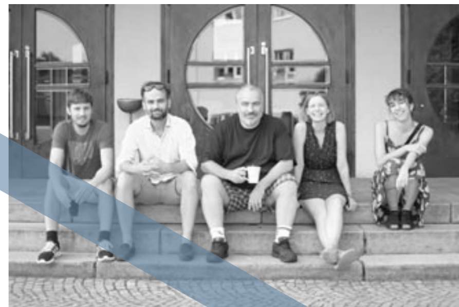
Archiv festivalu — Nové Vize, Tým