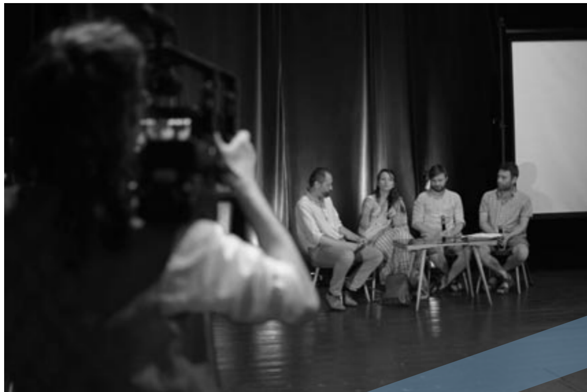
Nové Vize, rozborové semináře