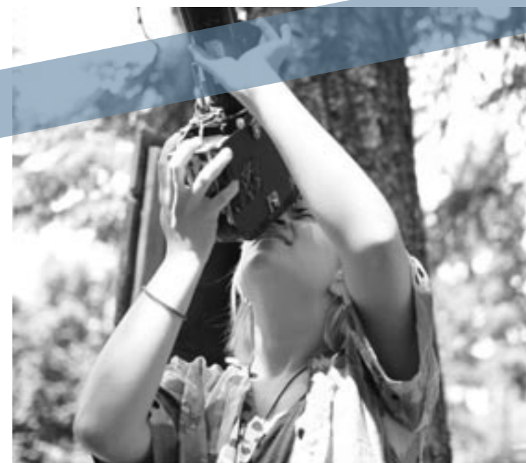
Nové Viz, workshopy