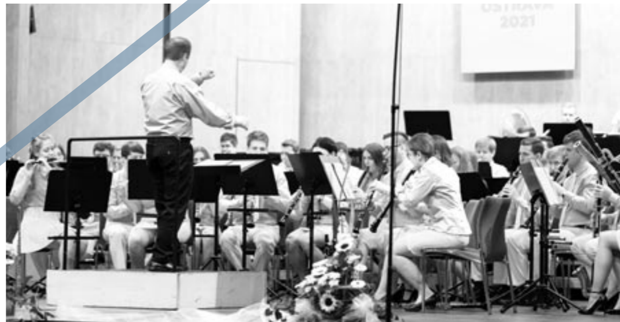
Velké dechové orchestry Ostrava 2021