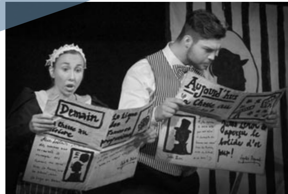
Archiv festivalu — Suchdolský divadelní spolek SUD Suchdol nad Luznici, Honba za meteorom male