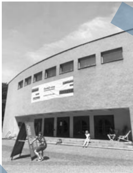
Archiv festivalu — Nové Vize, Roškotovo divadlo