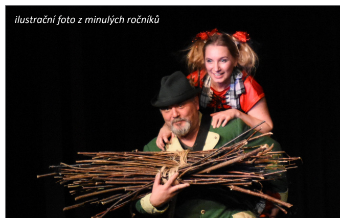
ilustrační foto z minulých ročníků

V roce 2020 se celostátní přehlídka kvůli epidemické situaci nekonala. Původně bylo vypsáno 12 krajských postupových přehlídek, z nich