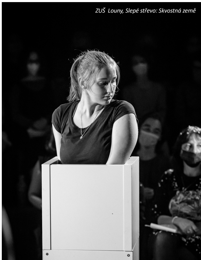
ZUŠ Louny, Slepé střevo: Skvostná země

Kromě změny termínu se epidemie promítla i do počtu účastníků (cca o 30 recitátorů méně než v loňském roce), ne ale do kvality výkonů. Kategorie divadel přinesla tematicky i formálně zajímavá představení. Sólové přednesy byly tradičně výborné ve třetí kategorii, ale špičkové výkony přinesly i obě mladší kategorie. Přestože diváci byli nuceni se v rámci povinných opatření pohybovat v hledišti v rouškách, atmosféra přehlídky byla velmi pozitivní a vstřícná. Všichni si uvědomovali, že její konání není samozřejmostí.