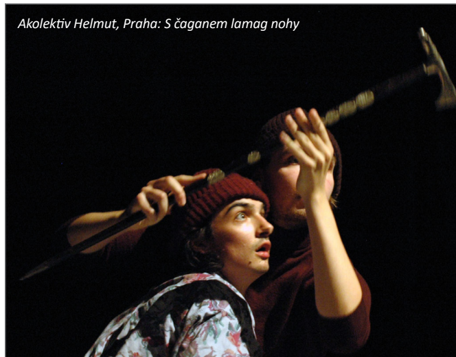
Akolektiv Helmut, Praha: S čaganem lamag nohy

Dva soubory byly nominovány do programu Jiráskova Hronova, další čtyři získaly doporučení.