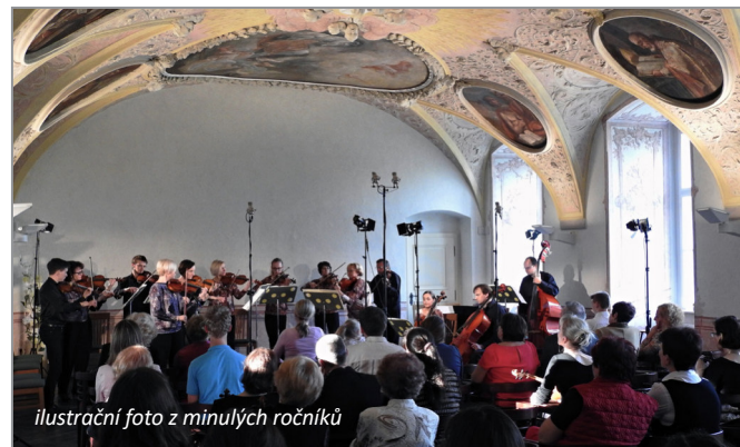
ilustrační foto z minulých ročníků

Na 7 koncertech festivalu mělo vystoupit celkem 19 hudebních souborů (1 pěvecký sbor, 9 komorních orchestrů, 1 klarinetový soubor, 8 flétnových souborů), což představuje 300 muzikantů. Kromě jed-