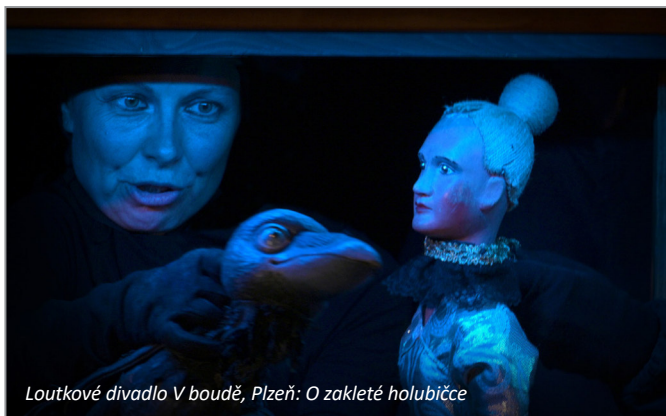
Loutkové divadlo V boudě, Plzeň: O zakleté holubičce