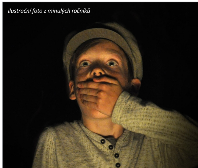
ilustrační foto z minulých ročníků

Přehlídka byla na jaře 2020 zrušena včetně krajských postupových kol. Důvodem byla protiepidemická opatření, která zahrnovala i uzavření základních a základních uměleckých škol. Před vyhlášením mimořádných vládních opatření stačila výjimečně proběhnout některá oblastní/obvodní postupová kola.