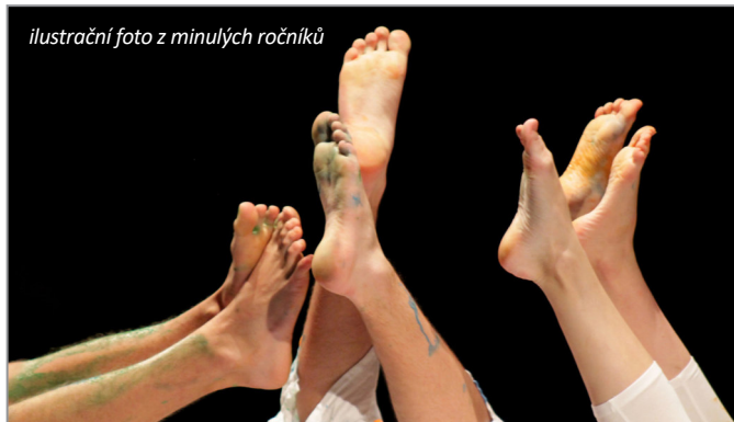
ilustrační foto z minulých ročníků

Přehlídka byla na jaře 2020 zrušena včetně krajských postupových kol. Důvodem byla protiepidemická opatření, která zahrnovala i uzavření středních a základních uměleckých škol. Stačila proběhnout jen dvě postupová kola konaná v únoru v Turnově a v Praze. Jediný postupující soubor, který vzešel z tohoto předvýběru, využil možnosti vystoupit na celostátní přehlídce Šrámkův Písek, kterou se podařilo uskutečnit.