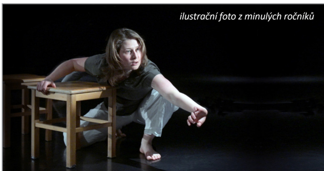
ilustrační foto z minulých ročníků

Pandemie nemoci covid-19 poznamenala i tento festival. Nejprve došlo k jeho přeložení z tradičního červnového termínu na 2.–4. října 2020 a také k programovým úpravám. Festival měl být o jeden den kratší – bez čtvrtěční přehlídky v divadle. Důležité však bylo, že zůstala zachována celá vzdělávací a tvůrčí složka festivalu – dílny, semináře, výstupy z nich, podnětná setkání pedagogů a lektorů. Nakonec byl festival z důvodů vládních opatření i v náhradním termínu zrušen.