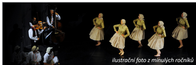
ilustrační foto z minulých ročníků