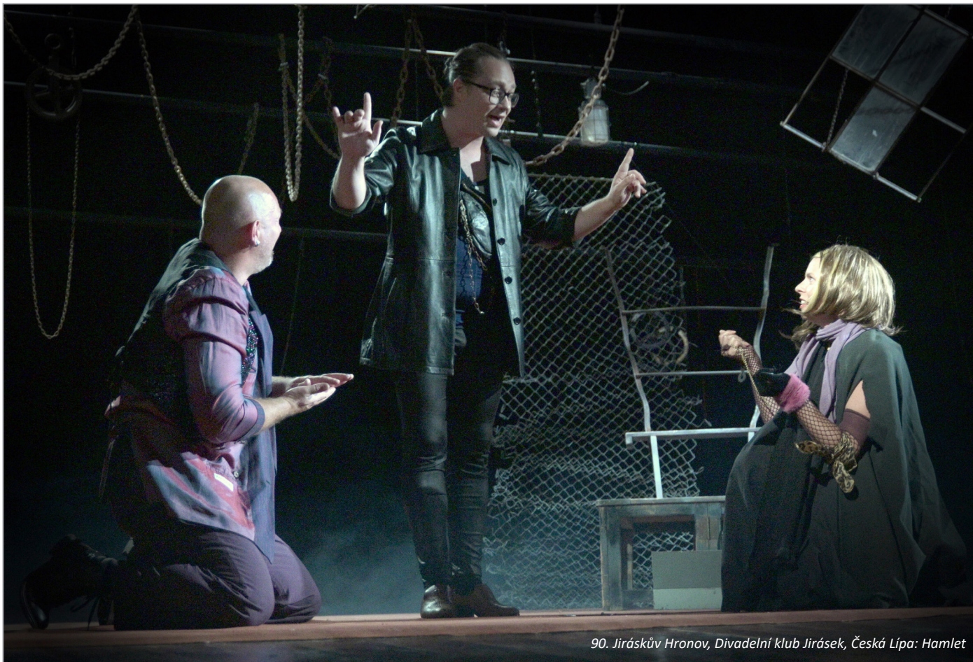
90. Jiráskův Hronov, Divadelní klub Jirásek, Česká Lípa: Hamlet